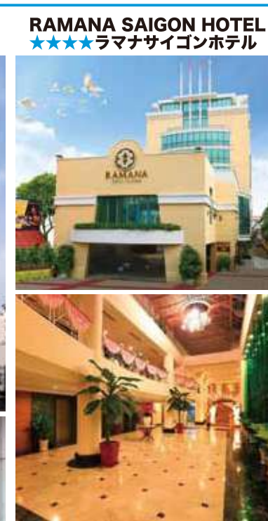
RAMANA SAIGON HOTEL ★★★★ラマナサイゴンホテル