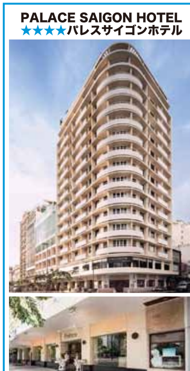
PALACE SAIGON HOTEL ★★★★パレスサイゴンホテル