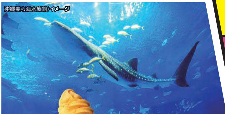
ブルーシール アイスクリーム/ イメージ