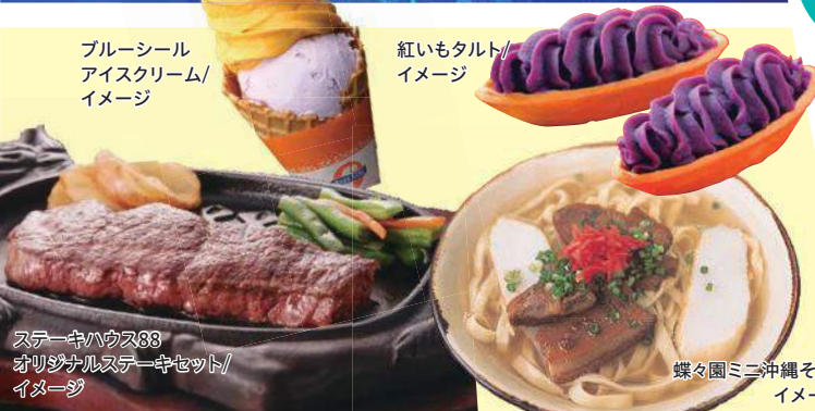
ステーキハウス83 オリジナルステーキセット/ イメージ