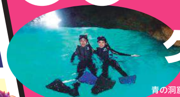
青の洞窟シュノーケル(イメージ)