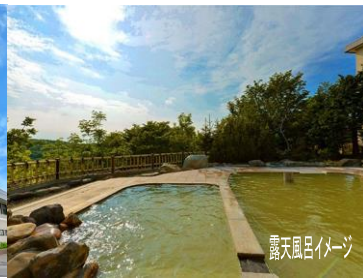
露天風呂イメージ