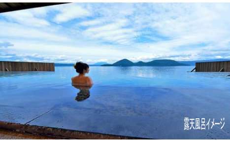
露天風呂イメージ