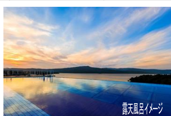
露天風呂イメージ