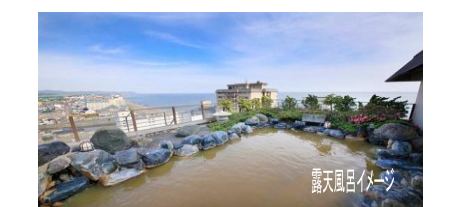
露天風呂イメージ