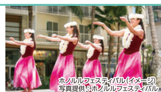
ホノルルフェスティバル(イメージ)

1995年、日米友好を目的に始まったホノルル フェスティバルは、日米間の文化交流の域を超えてオーストラリア、カナダ、イタリア、メキシコ、フィリピン、台湾、韓国、ニュージーランドなど環太平洋の国々との交流へと成長してきました。今では、毎年3月に開催される恒例行事として定着し、環太平洋の文化交流促進支援事業として、ハワイ最大の国際的な文化交流イベントとなっています。