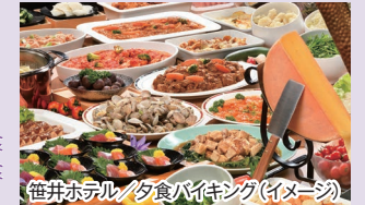
笹井ホテル/夕食バイキング(イメージ)

十勝川温泉を代表する老舗ホテル。十勝産ラクレットチーズや北海道産食材を使ったオリジナル料理が並ぶ夕食バイキングが人気です。