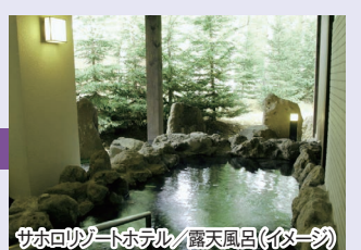
サホロリゾートホテル/露天風呂(イメージ)

周辺に光源が少ないため 好天時には満天の星空に出会える 自然豊かなリゾートホテル。露天風呂付スパで旅の疲れを癒せます。