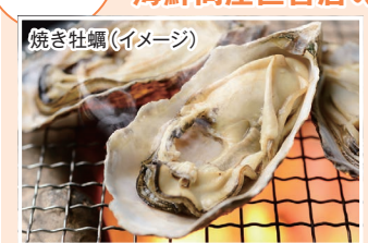
焼き牡蠣(イメージ)