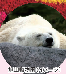
旭山動物園(イメージ)

数々の花が咲き誇るファーム富田&四季彩の丘、ひまわり咲くぜるぶの丘やコバルトブルーの神秘的な白金青い池など絶景スポットめぐり。