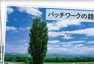
パッチワークの路