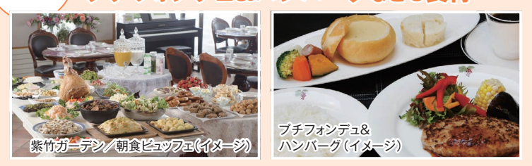
紫竹ガーデン/朝食ビュッフェ(イメージ)